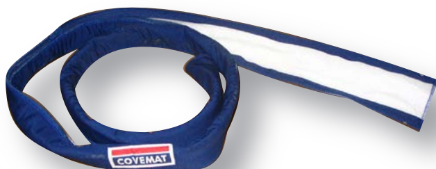
Gaine isolante Lg :2m